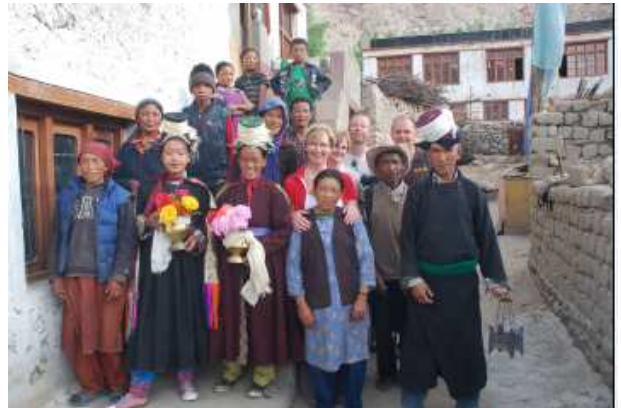
Het ontvangstcomité samen met B.Connected.

De bewoners van Digger hadden een superontvangst voor ons geregeld. Ze stonden, in traditionele Ladakh kleding, op ons te wachten aan het begin van het dorp en begeleidden ons het laatste stuk naar de woning van de hoofdonderwijzer (tevens ons onderdak voor die nacht).