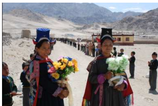
Ouders en kinderen verwelkom ons bij de school.

De dag daarop zijn we 's ochtends met de bus naar school gegaan. Tegenwoordig moet de bus twee ritten maken om alle kinderen op te halen. Iets wat wij een bijzonder goed teken vinden. Bij de school stonden kinderen en ouders, in de klederdracht van Ladakh, ons op te wachten.