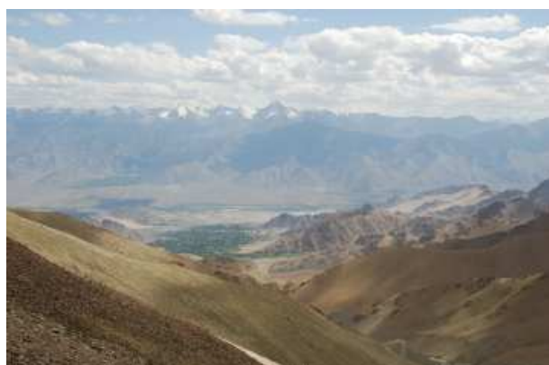
Vanaf de Kadungla zicht op de vallei van Leh

De terugtocht naar Leh ging via de hoogst berijdbare weg ter wereld. De te passeren pas (de Kadungla) is met z'n ruim 5600 meter hoogte een adembenemende oversteek.