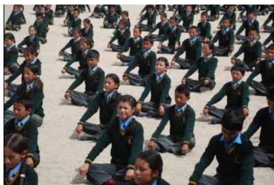
Momenten van bezinning tijdens ochtendceremonie.

Nadat we 160 handen hadden geschud en de dagelijkse ochtendceremonie hadden bijgewoond, konden we beginnen met het echte werk.