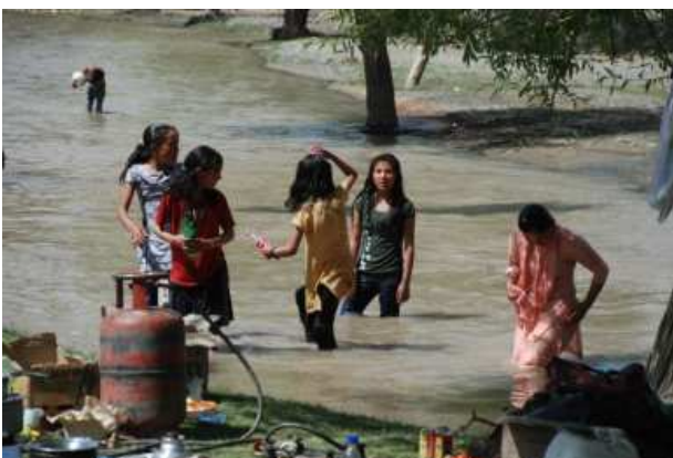
Kinderen en leerkrachten in het water.