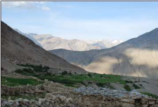
Zicht op Digger, een kleine groene oase hoog in de Himalaya.

Het is een klein schooltje in Digger in de Nubravally, een plaatsje waar ongeveer 60 gezinnen wonen.