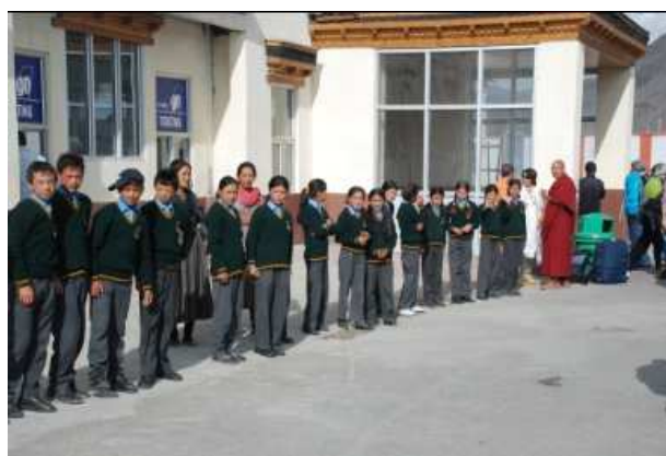
Ontvangst op het vliegveld Leh.

Zoals gebruikelijk stonden leerlingen, onderwijzers en oudercomité van de RIGLAM school ons al op te wachten op het vliegveld. De eerste vlucht uit Delhi arriveert al rond zes 's ochtends in Leh, wat betekent dat de kinderen erg vroeg op moeten om ons op te wachten. Het geeft wel een ontzettend warm gevoel om iedereen weer te zien.