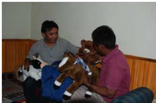
Grote blijde kinderen, oh nee: leerkrachten.

Waar we niet alleen de leerlingen blij mee hebben gemaakt, maar ook de leerkrachten, zijn alle knuffels.