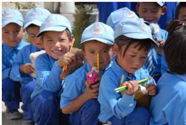
Kinderen voor kinderen – kunst voor kids

hen op zijn plaats. Maar wij danken uiteraard ook alle bezoekers. Namens B.Connected en de kinderen van de RIGLAM-school in India, heel erg bedankt.